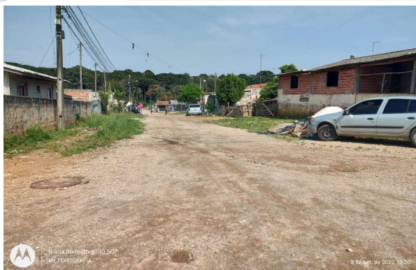
RUA ONOFRE SANTOS BRUNNATO