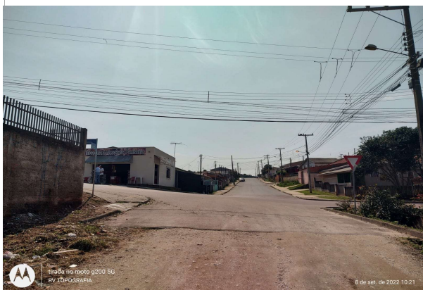
RUA CASSEIRO SZCZPIOR