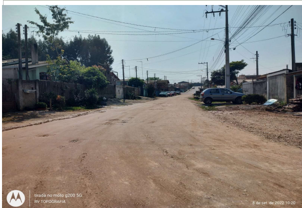
RUA CASSEIRO SZCZPIOR