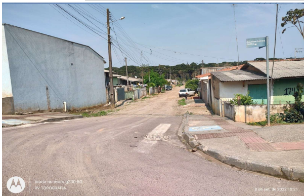
RUA ONOFRE SANTOS BRUNNATO