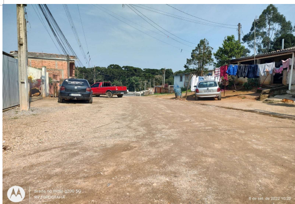
RUA CASSEIRO SZCZPIOR